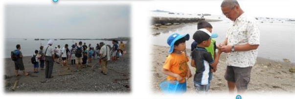
浜や磯で生物探し