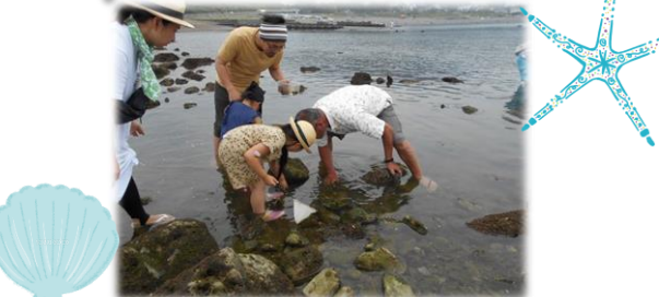
見つけた磯の生物の観察会